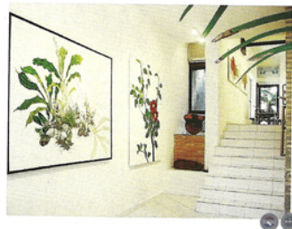
MUESTRA YUKI HAYASHI 2008.