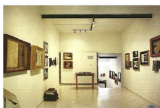
▲ MUESTRA ARANDURÁ 2009.