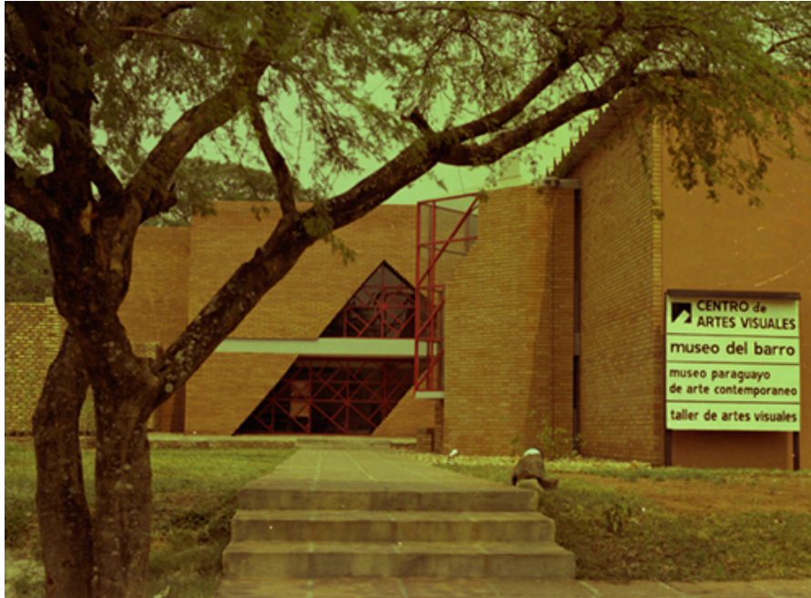
Museo del Barro en obras, 1987