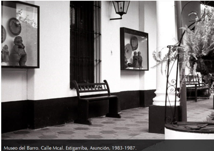
Museo del Barro. Calle Mcal. Estigarriba, Asunción, 1983-1987.