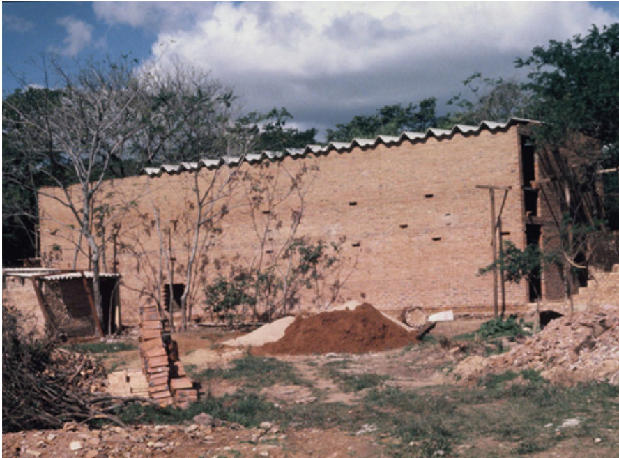
Construcción de la Sala Josefina Plá en el Museo del Barro

“La relación que establecen las obras arquitectónicas de Colombino con el entorno urbano y paisajístico pone de manifiesto esa vocación de articular de maneras novedosas lo público y lo privado. Una rara fluidez de esas relaciones emana de ellas. Son espacios privados que de un modo u otro, están al servicio del espacio público. O, más bien, están creando un concepto nuevo de espacio público allí donde no lo había. El caso del Museo del Barro es tal vez el más claro y evidente. Tal vez lo que ocurrió cuando una tormenta voló su techo y los vecinos acercaron espontáneamente su ayuda para reconstruirlo sea la anécdota que mejor ilustra lo que quiero decir. (...)