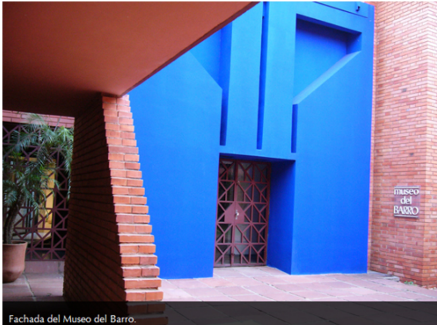
Fachada del Museo del Barro.