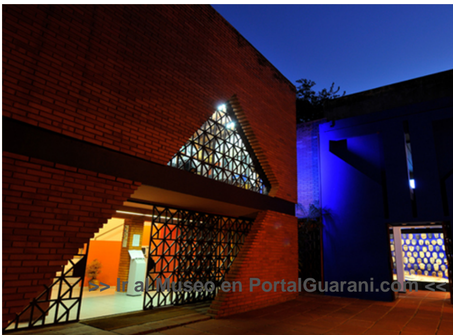
Fachada del Museo del Barro (Foto: Fernando Allen)

Fuente: http://www.museodelbarro.org/ (Registro: Junio 2011)