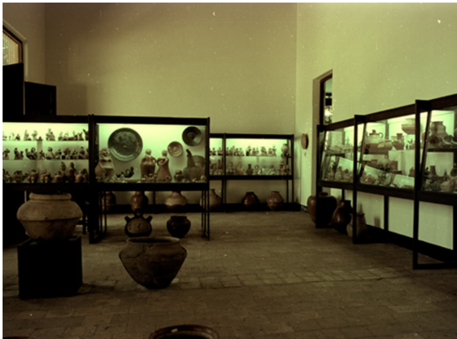
Museo del Barro, San Lorenzo 1980-1983