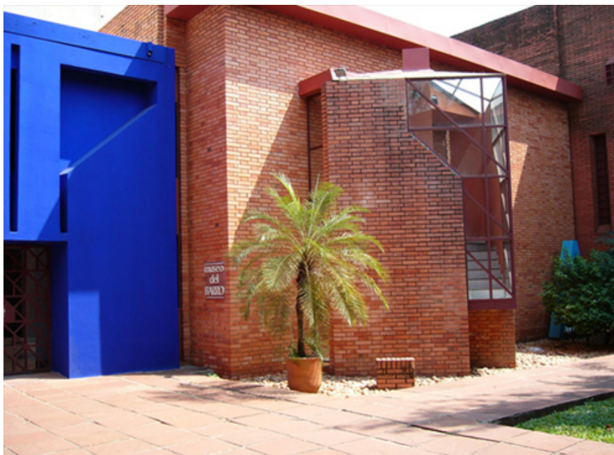
Patio interior del Museo del Barro.

La Fundación Carlos Colombino Laila es la Persona Jurídica que respalda al Centro de Artes Visuales que comprende en su conjunto al MUSEO DEL BARRO (arte popular del Paraguay), al MUSEO DE ARTE INDÍGENA (arte de las diversas etnias que habitan el país) y al MUSEO PARAGUAYO DE ARTE CONTEMPORÁNEO (arte actual iberoamericano).