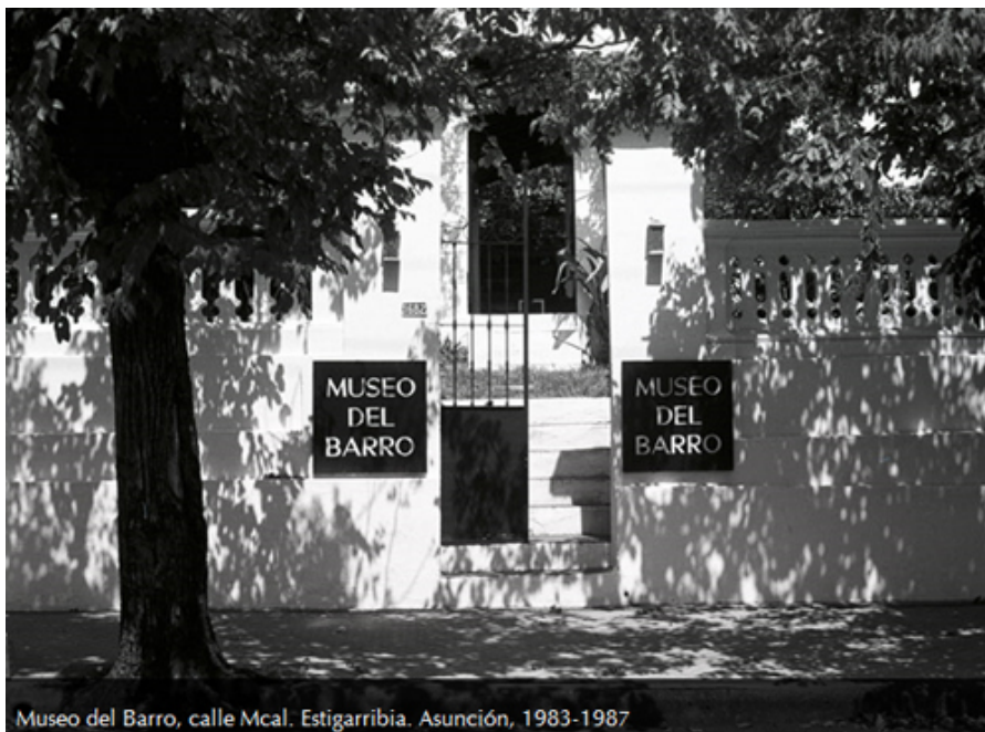
Museo del Barro, calle Mcal. Estigarribia. Asunción, 1983-1987