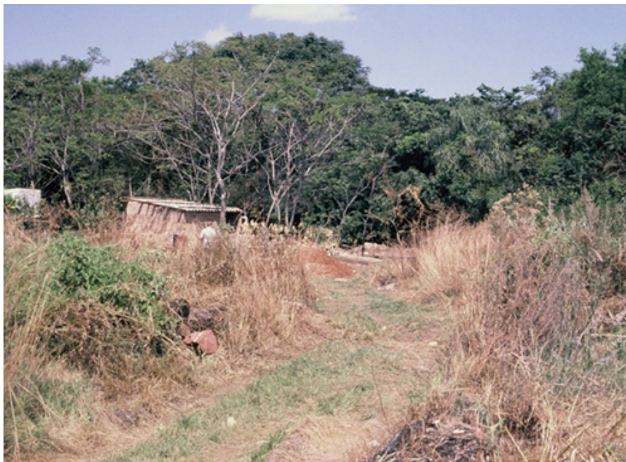
Terreno en Isla de Francia