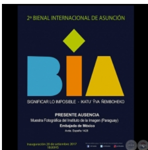
Grupo Gente de Arte - Sábado, 2...