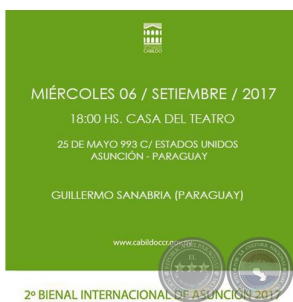
2ª BIENAL INTERNACIONAL DE ASUNCIÓN 2017