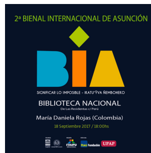
Proyecto Poroso - Artistas: Mar...