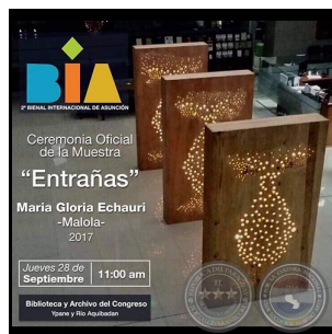
Tributo a Olga Blinder - Viernes...