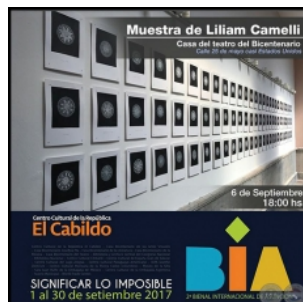
2ª BIENAL INTERNACIONAL DE ASUNCIÓN 2017