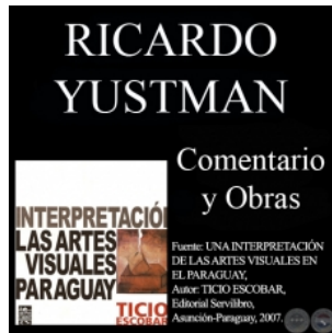
OBRAS DE RICARDO YUSTMAN Y COME...